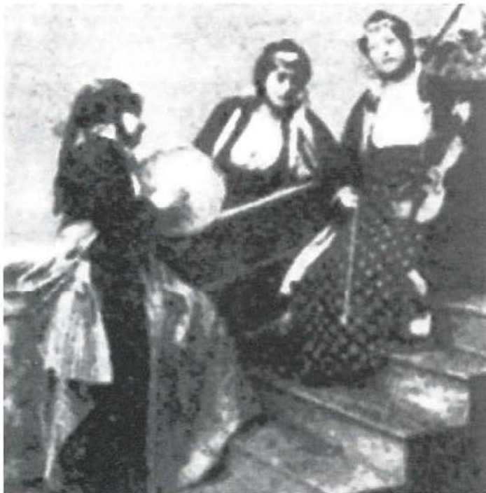
מנגנון יהודיח בשאלוניקי [מאה י"ט] מתוך: זכרון שאלוניקי בעריכת דוד א. וקאנטי, נדך ב'. עמ' 404, חל-אביב תשמ"ב

הכנסת אורחים וביקור חולים. דומה כי אלמלא היו דברים בגו, אלמלא חשה אשת החיל, באורח אינטואיטיבי כמעט, סלידה מהאורח המטריח עליה עד מועקה, אלמלא סלדה מאותו "פיסגדו" כפייתי (המתעקש לפצוח בשיר "בלי הטרחה") המעורר בה רתיעה נוראה בשירו המשונה, יקשה עד מאוד להסביר את התנהגותה.